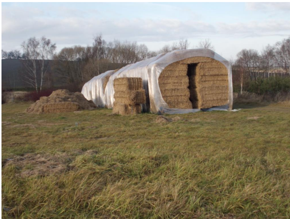
Uskladnění balíků na poli u Postupic

Fotografie, které jsem pořídila 11. 12. 2011: