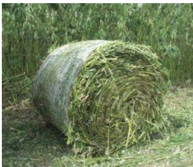
Balík krmného šťovíku