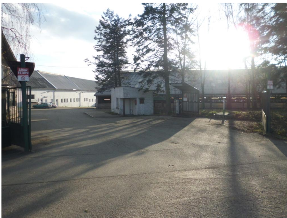
Vchod do DZS a JZD Struhařov