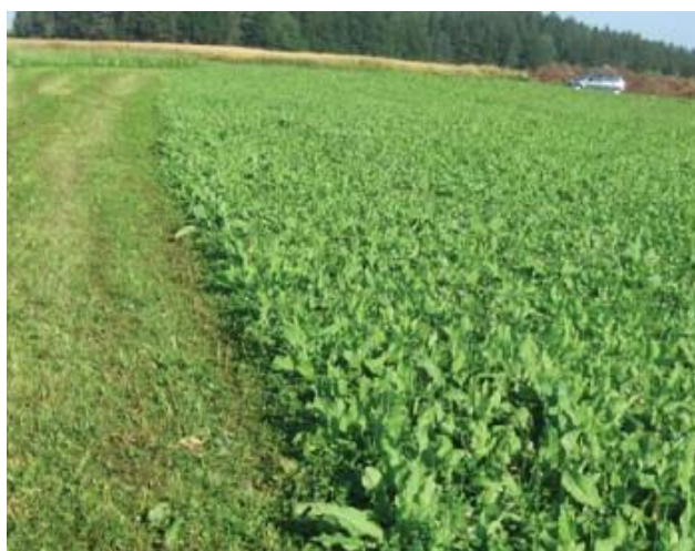
Rumex OK 2 sklizený ke krmení dojnic