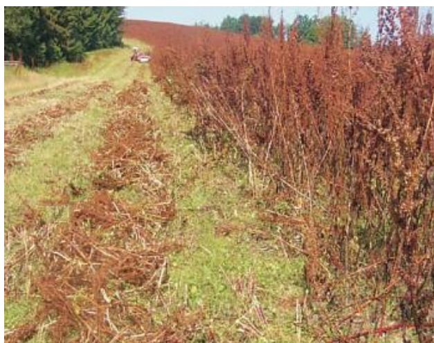
Sklizeň Rumexu OK 2 na suchou biomasu

Fotografie, které mi poskytla moje konzultantka inženýrka Petříková: