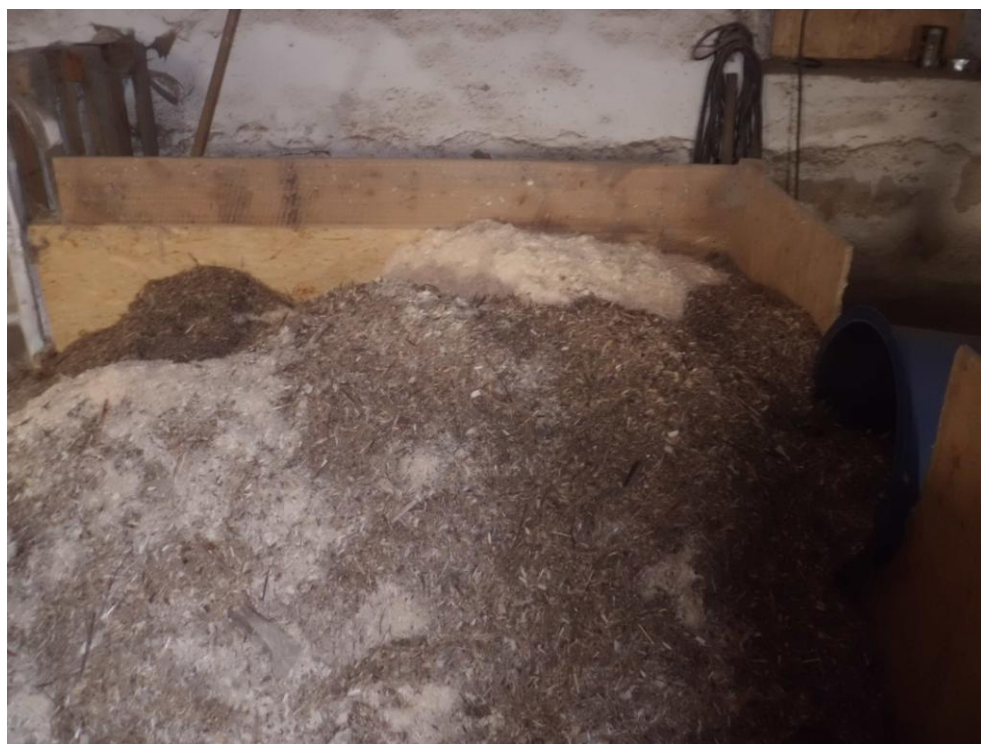
Materiál připravený ke slisování