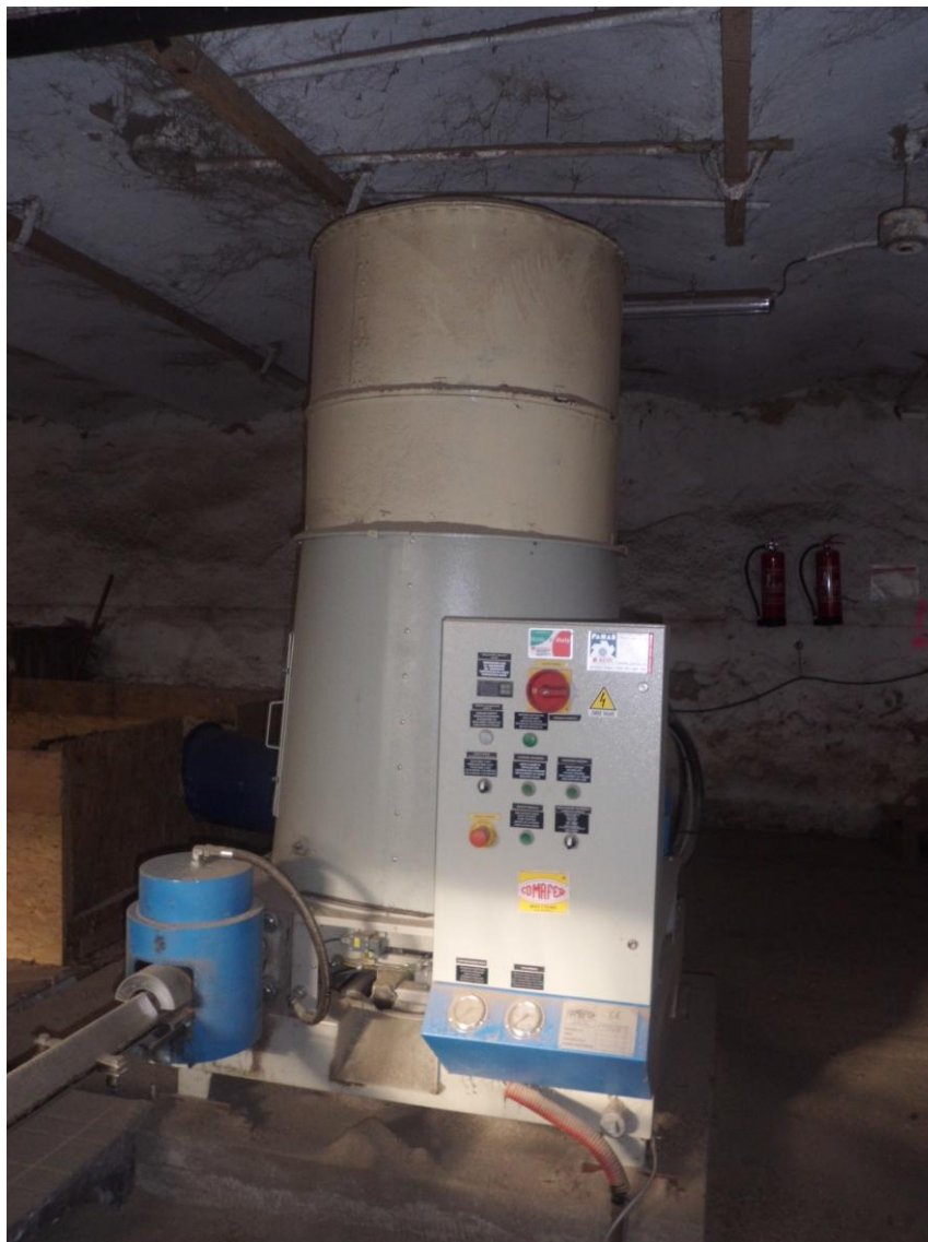
Lis na brikety majetkem hrabství Jemniště, využívaný družstvem