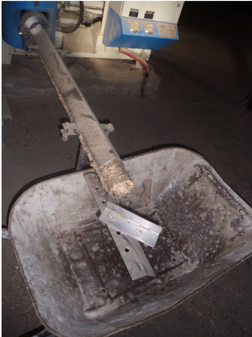
Odběr hotových briket