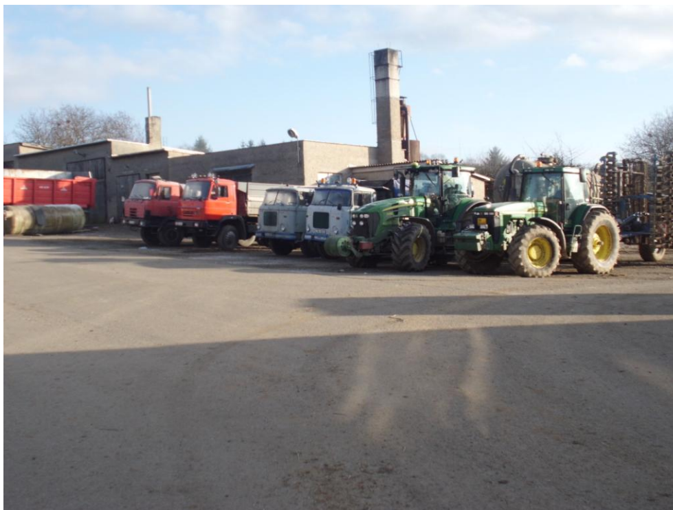
Stroje používané ke zpracování šťovíku